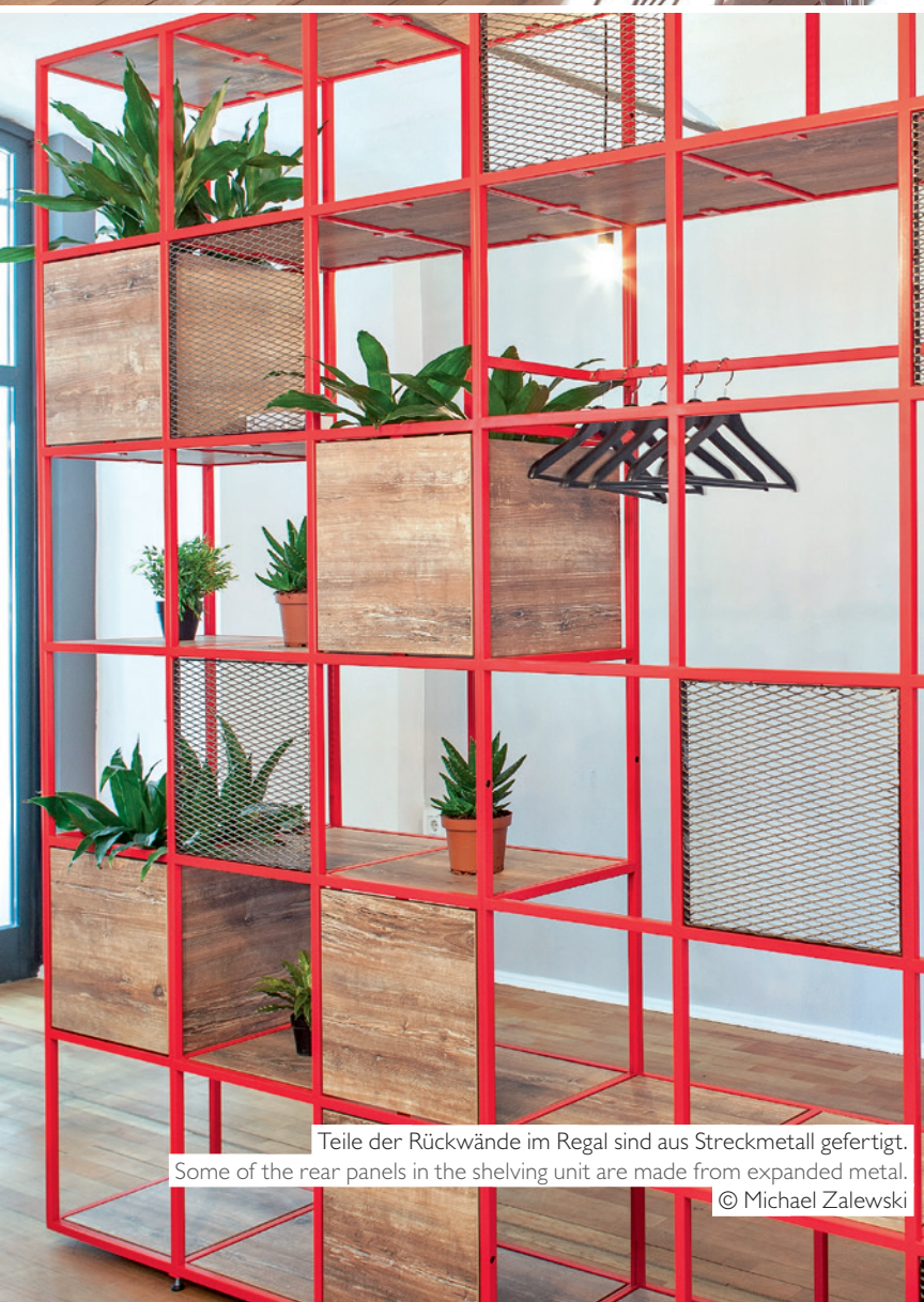
Teile der Rückwände im Regal sind aus Streckmetall gefertigt. Some of the rear panels in the shelving unit are made from expanded metal.