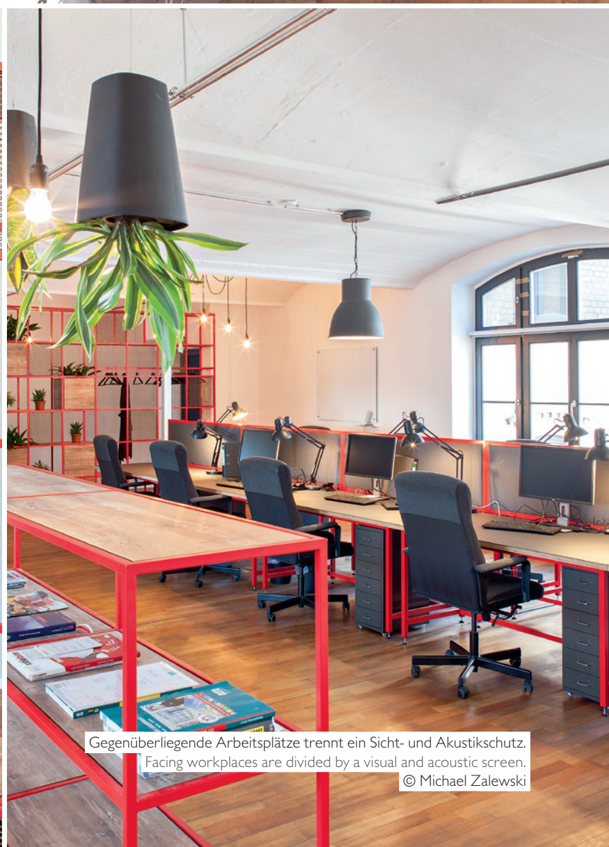
Gegenüberliegende Arbeitsplätze trennt ein Sicht- und Akustikschutz. Facing workplaces are divided by a visual and acoustic screen.