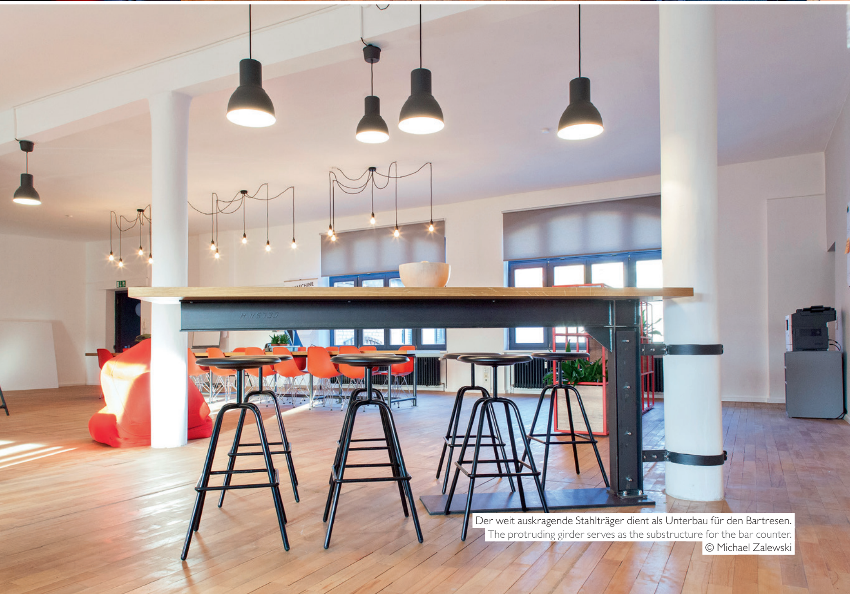
Der weit auskragende Stahlträger dient als Unterbau für den Bartresen. The protruding girder serves as the substructure for the bar counter.