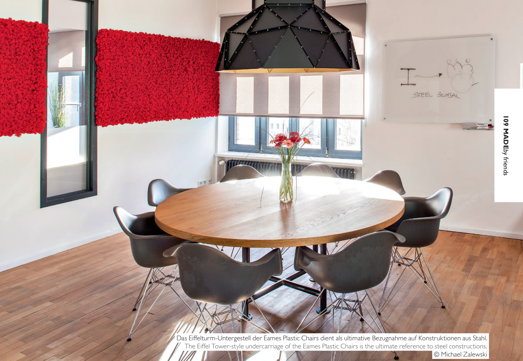
Das Eiffelturm-Untergestell der Eames Plastic Chairs dient als ultimative Bezugnahme auf Konstruktionen aus Stahl. The Eiffel Tower-style undercarriage of the Eames Plastic Chairs is the ultimate reference to steel constructions.